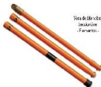
Vara de Manobra Seccionável - Ferramentas -